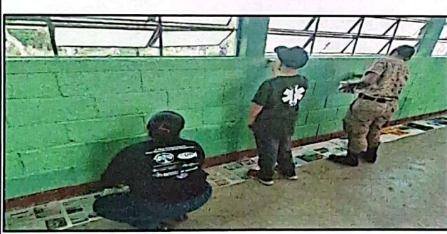
Foto 3: PINTURA EN INTERIOR Y EXTERIOR DE LOS MODULOS, DIRECCIÓN Y AULAS