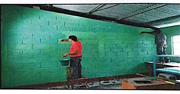
Foto 4: PINTURA EN INTERIOR Y EXTERIOR DE LOS MODULOS, DIRECCIÓN Y AULAS