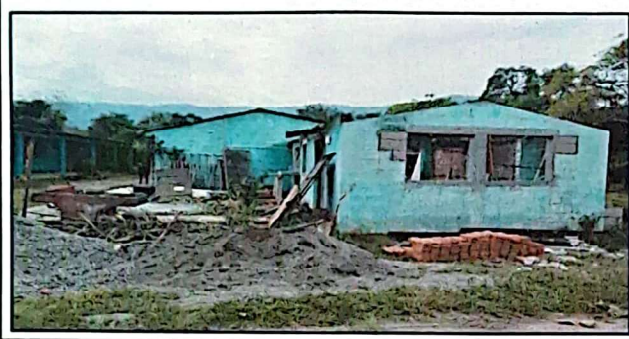
Foto1: REPARACIÓN ÁREA DE COCINA